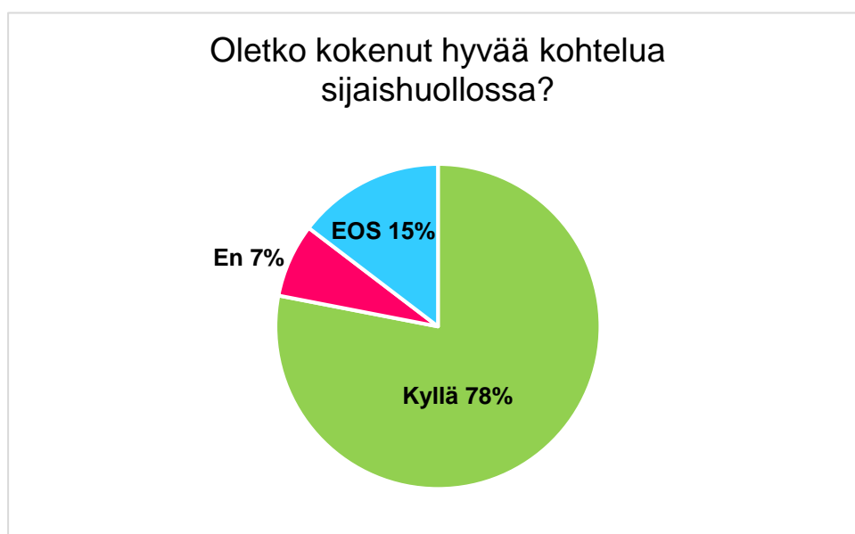
Kuvio 4: Oletko kokenut hyvää kohtelua sijaishuollossa?

Suurin osa nuorista oli kokenut sekä hyvää että huonoa kohtelua sijaishuollossa ollessaan. Tämä on ymmärrettävää, sillä vastausten perusteella huonoa sijaishuoltoa saattoi laitoksessa edustaa nuorelle epämieluisa ohjaaja, ja hyvää taas mukava ohjaaja. Ne nuoret, jotka olivat asuneet useissa eri yksiköissä, vertailivat myös sijaishuoltopaikkoja keskenään.