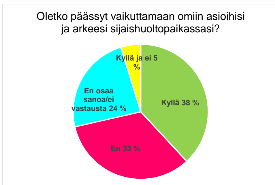
Kuvio 6: Oletko päässyt vaikuttamaan omiin asioihisi ja arkeesi sijaishuoltopaikassasi?

Lasten ja nuorten osallisuudesta eli vaikuttamisesta oman elämänsä tärkeisiin asioihin puhutaan paljon lastensuojelussa. Lastensuojelulain uudistukset ovat pyrkineet lisäämään lasten osallisuutta erilaisin keinoin. Vuoden 2020 lakiuudistuksessa lastensuojelulaitoksia veloitetaan laatimaan hyvän kohtelun suunnitelma, jolla pyritään lisäämään suunnittelua esimerkiksi rajoitustoimenpiteistä, menettelytavoista ja toimenpiteistä lasten ikätasoisesta itsemääräämisoikeuden vahvistamiseksi. Kyselyn osallisuutta koskevassa kysymyksessämme vältimme käyttämästä osallisuus-termiä, sillä sen sisältöä voi olla vaikea hahmottaa. Sen sijaan puhuimme omiin asioihin vaikuttamisesta.